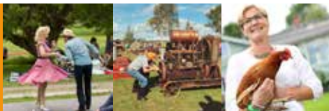
LOVIISA – LOVISA